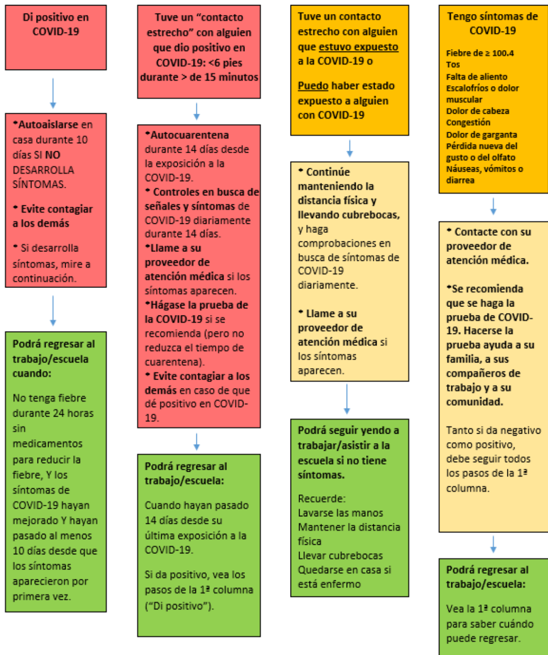
DIAGRAMA DE FLUJO "AHORA QUÉ"